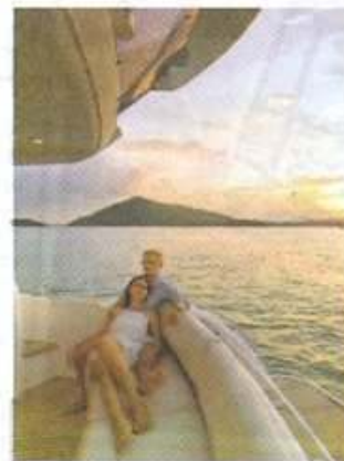
LOS TURISTAS mexicanos destinan hasta 35,000 dólares para su luna de miel.

"Los Cabos es el único destino de playa en el mundo que también es un desierto. Además de las múltiples aperturas de propiedades de lujo en puerta, tenemos campos de golf, los mejores hoteles y una gastronomía sobresaliente. Todos deberían visitar nuestras granjas orgánicas que permiten, por ejemplo, cortar los vegetales directo del huerto", recomendó.