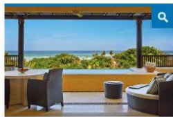
Viagem com várias gerações da mesma família tem colocado em alta a procura por espaços maiores, como a rede Four Seasons em Punta Mita

Esse estilo de viagem tem colocado em alta a procura por espaços maiores. Assim, várias cadeias de hotéis estão respondendo à demanda por hospedagem em grupo, oferecendo residências, grandes suítes e "villas". Entre as marcas que estão no portfólio da Virtuoso, o The Ritz-Carlton das Ilhas Cayman inaugurou no início de fevereiro uma "penthouse" que, combinada a uma suíte, pode chegar a 11 quartos e é a maior do Caribe. As diárias começam em US$ 15 mil.